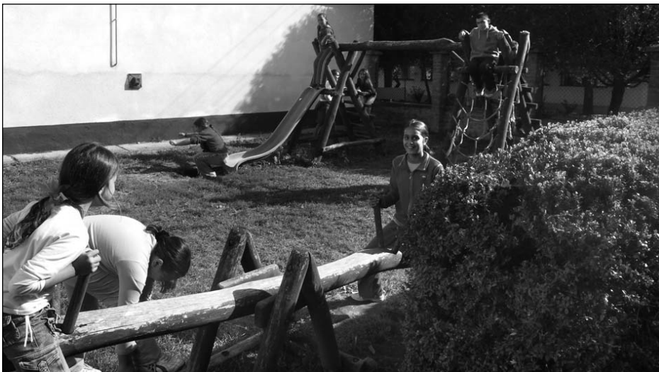
Telecentrele în Ungaria au o conotație profundă de Centru comunitar

Mai multe detalii privind experiența pozitivă a Ungariei pot fi accesate pe site-ul http://infocentru.wordpress.com