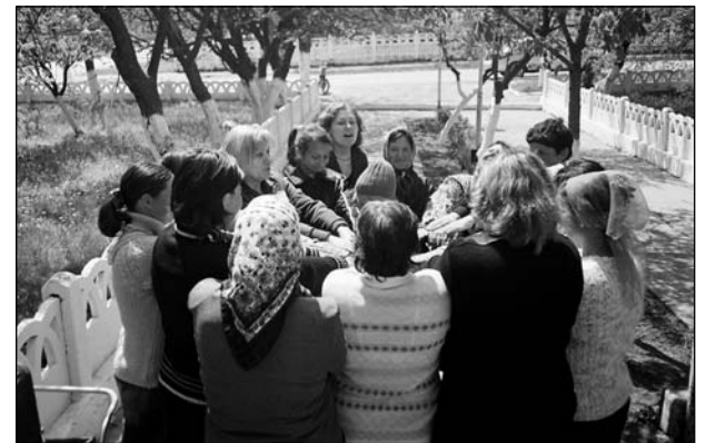
Unde-s mulți, puterea crește!

De rînd cu formarea familiilor vulnerabile în subiectele menționate mai sus, Centrul Pro Comunitate în parteneriat cu Facultatea de Asistență Socială, Sociologie și Filosofie a USM, care a oferit suportul teoretic necesar, a editat Ghidul pentru Rețelele de Suport