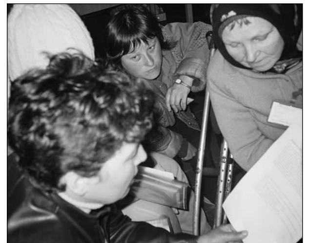
Membrii rețelei de suport reciproc din s. Popeasca învață împreună despre drepturilor lor

În ultima fază a proiectului, în localitățile pilot a fost organizat seminarul „Ce este ajutorul reciproc și cum poate fi organizat”. La seminar au participat membri ai rețelelor de ajutor reciproc, lideri locali, cadre medicale, asistenți sociali – coordonatori ai rețelelor la nivel local, precum și reprezentantul Centrului de Resurse pentru Gestionarea Investițiilor din or. Ștefan Vodă, care a monitorizat procesul de creare a rețelei la nivel de raion. În urma seminarului, beneficiarii au realizat importanța solidarității dintre membrii rețelei și capacitatea acestora de a identifica și valorifica resursele locale (jucării și hăinuțe oferite de familiile ai căror copii au crescut deja, rechizite pentru școală sau alte bunuri de necesitate stringentă pentru familiile social-vulnerabile, medicamente). În final, ei au afirmat că, de fapt, nu există „oameni fără probleme”, există oameni cu experiență mai mare în depășirea problemelor.