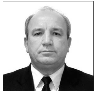
Mihai Pop, ministrul Finanțelor

"Relațiile interbugetare sînt determinate de anumite norme, care au la bază cheltuielile medii ce revin la un locuitor din teritoriu, numărul populației, structura demografică a teritoriului, baza fiscală a acestuia și alți parametri. Acești parametri sînt transparenți, se publică pe site-ul Ministerului Finanțelor. În afară de aceasta, noi am coordonat proiectul bugetului cu toate autoritățile publice centrale și locale, la dezbateri au participat președinții de raioane și ele au început cu mult înaintea alegerilor locale. Din actualii președinți de raioane doar patru nu au participat la dezbateri, iar restul au avut posibilitatea să-și expună părerile", a subliniat el. Mihai Pop a mai spus că 97 mln. lei vor fi transferați, în 2008, de la bugetul de stat către bugetul mun. Chișinău, care după aplicarea cotei 0 a impozitului pe venit va rata venituri de circa 300 mln. lei.