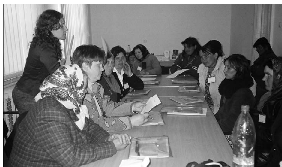
Secvență de la seminarul „Ce este ajutorul reciproc și cum poate fi organizat”