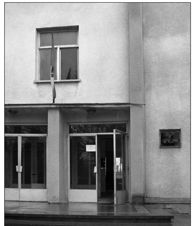
Primăria colaborează fructuos cu Asociația de Beneficiari

Liceul și grădinița sînt asigurate cu hrană din partea Administrației Publice Locale și a Consiliului Raional, contribuția părinților fiind minimă. În acest context, aș remarca implicarea mai multor agenți economici care doresc să ajute copiii de la aceste instituții”.