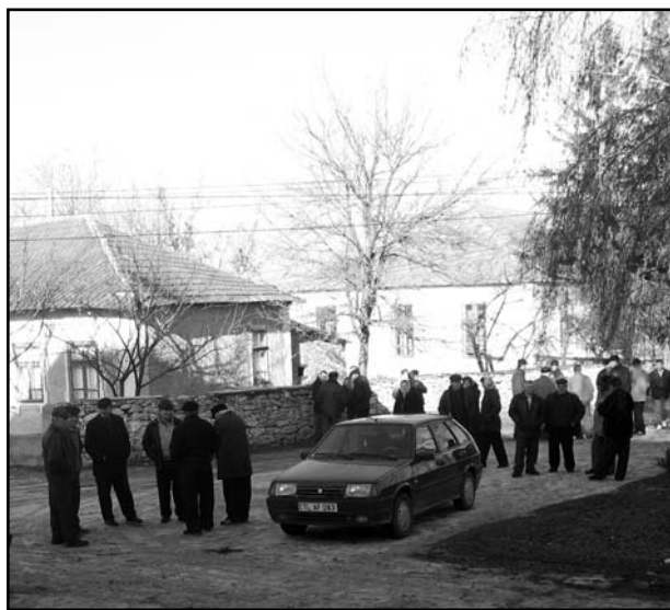
Locuitorii satului vin la Adunarea Generală

au participat reprezentanți ai tuturor categoriilor de vîrstă, alături de persoanele în etate fiind prezenți și foarte mulți tineri.